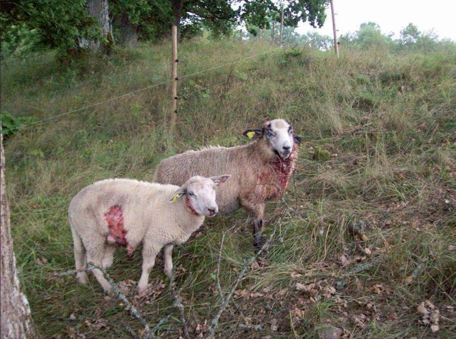
I livet ännu en kort stund. Ena lammet har uppsliten sida och andra uppslitsad hals och avslitet öra.

ten av vargreviren. Där river hungern i magarna på både vargföräldrar och valpar under sommaren. Vargungarna är avvanda och behöver stora mängder kött. De små har lämnat lyan och hänger vid speciella rendezvous-platser, mötesplatser där föräldrar och ungar strålar samman några gånger per dygn. Dessutom vandrar de vuxna vargarna långa sträckor i jakt efter byte. När de är stora nog får även ungarna delta i jakten.