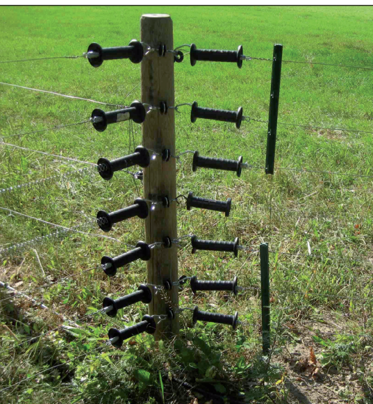
Ett rovdjursstängsel kostar stora pengar att sätta upp och underhålla. Även det dagliga arbetet försvåras. Så här många trådar kan det bli att hantera när djur skall flyttas från en hage till en annan.

hägna stora och kuperade marker mot rovdjur. Nästan ingen fårbonde har resurser för att driva ner brytstolp en hel meter i marken. För detta måste man leja och det gäller att passa på när det är lämpliga markförhållanden.