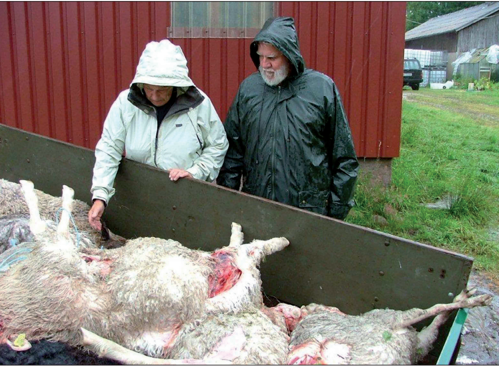
Ett angrepp av rovdjur innebär inte bara ekonomiska förluster. Den känslomässiga förlusten kan vara den tyngsta att bära.

Stämningen är förtätad, sorgsen, skärpad och uppgiven. Det är möte i Bysala Hembygdsgård med anledning av att varg härjar bland fåren. Stolarna står tätt packade inne i lokalen. Många står på tå utanför huset, försöker höra genom de öppna fönstren.