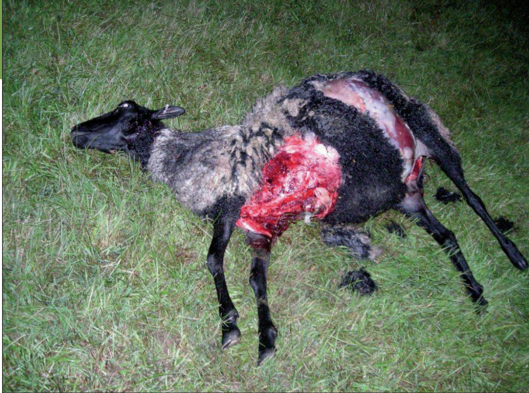
En besättning mitt i Västmanland har i år förlorat 62 lamm, 20 tackor, 2 kalvar och en kviga, förmodligen till både lo och varg.

Den svenska vargpopulationen består officiellt av ungefär 220 vargar vars gener anses ovärderliga. Det finns cirka 150 000 vargar i världen så i globalt perspektiv är vargen inte en utrotningshotad art. I Sverige finns ett antal unika fårraser som däremot bokstavligen är på gränsen till utrotning, raser som inte finns någon annan stans i världen. Sju av allmogeraserna har färre än 500 individer. Rya-, åsen- och värmlandsfår består av mellan 1 000 och 2 000 djur. Gute-, skogs- och finullsfåren är några tusen av var ras. Vid ett av sommarens angrepp dödades 24 av 36 åsenfår i en besättning i Örebro län. Vid ett angrepp i Värmland dödades 7 avelsdjur av rasen värmlandsfår.